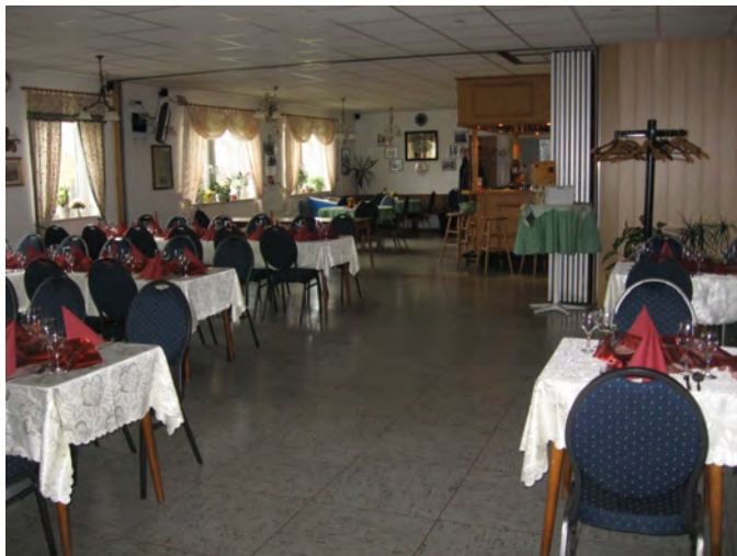
Platz für Feierlichkeiten mit bis zu 60 Personen